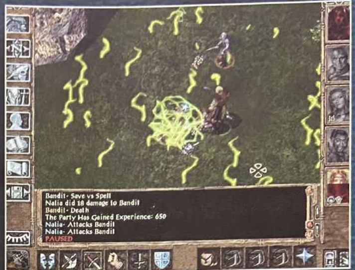
BioWare'in son AD&D bombası, Baldur's Gate II ile zarları bir kere daha sallayın.