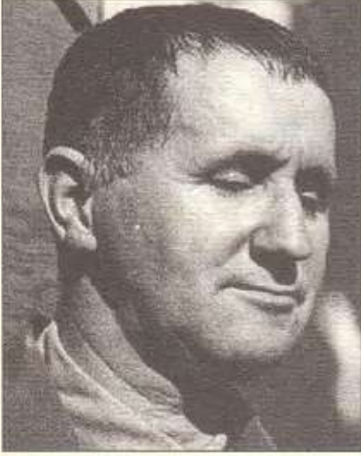
Brecht ile Eisler'in yolları 1928'de kesişti. Bu tarihten sonra pek çok yapıta imza attılar.

sanat olarak düşünüyor. Oysa Hanns Eisler toplumsal ve politik mesajı olan sanatın yolunu açan bestecilerden biri, belki de birincisidir. Herhalde sanat anlayışı ile ideolojik düşüncelerinin örtüşmesinden olacak, pek çok müzik tarihi ve müzik kitabında Eisler'in yaşamöyküsüne ya hiç rastlanmaz ya da kısaca geçitirilir. Oysa pek çok yapıt vermiş; oyun müzikleri, film müzikleri bestelemiş; müzik sanatı üzerine çok düşünmüş; müziğin işlevsel olmasını vurgulamış ve doğru bildiği sanat anlayışı uğruna elit besteciler arasında yer almayı önemsememiş bir müzikçiydi.