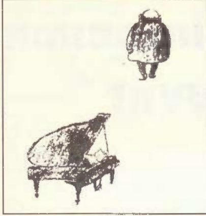
Eisler'in ölümü üzerine yapılmış bir çizim.

Odets'in, Brecht'in ve George Bernard Shaw'un oyunları için fon müziklerinin yanı sıra, sahne için çok sayıda parça ve Brecht'in metinlerine kantatlar yazdı.