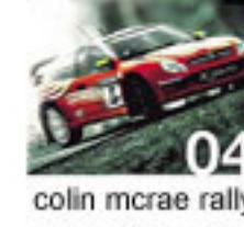
colin mcrae rally

Gördüğünüz gibi herşey ortada. Yeni bir CMR oyununun daha sonuna geldik. Ben bir yarış sever olarak herkeze tavsiyem bu oyunu arşivinizde bulundurmanız. Halen almadınızsa bence şimdiden CD'cinizin yolunu tutun. İyi oyunlar.